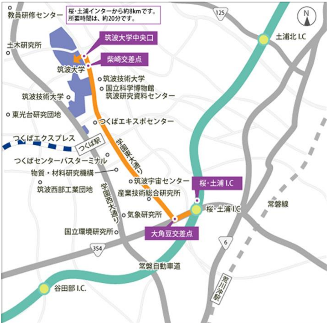
▲地図 A. 大学付近周辺