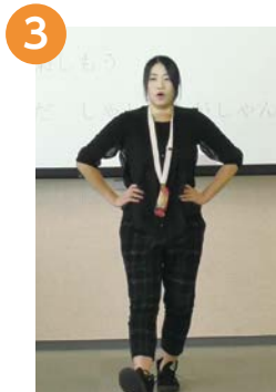
3 【年をとること 楽しもう】 腰に手を当てながら、 片足ずつ前に出します

一、みんな集まれ みんなラボ 使いやすさはいろいろあつて これを掘り出す金の山 みんなラボ音頭で しゃしゃんがしゃん 二、みんな集まれ みんなラボ ワイワイガヤガヤ皆の会 これがしかけよ 宝だよ みんなラボ音頭で しゃしゃんがしゃん 三、みんな集まれ みんなラボ 使いやすさはいろいろあつて 人世を動かす 知恵探し みんなラボ音頭で しゃしゃんがしゃん