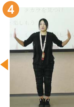
4 【みんなラボ音頭だ しゃしゃんがしゃん】 隣の人と手を合わせま す