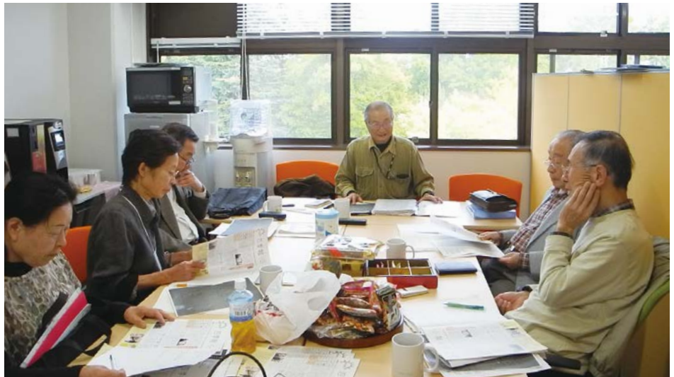
▲408室・会議スペースの様子