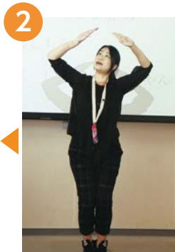
2 【くらしの中から タカラを見つけ】 両手を頭の上にかざし ます